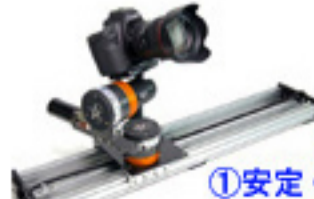
3 in 1 ①安定 ②前進撮影 ③TSドーリー 最長6m ZSドーリー