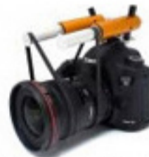
ズーム / フォーカス・ローテーター