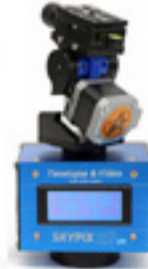
X3pt Pro 一眼レフ1台用

Pan/Tilt ローテーター内蔵 プログラム動作 マニュアル設定動作 正確パルスモーター