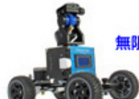
無限走行 長さ無限 スケート・ドーリー