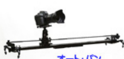
オート・パン 最長1.5m APドーリー