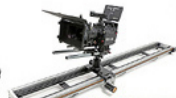
大型機器用高速精密 最長1.8m Wドーリー